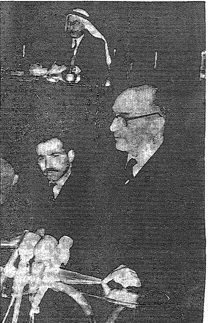
دولة السيد بهجت التلموني رئيس الوزراء يلو بيانه

كلمة عريقات وبعد ان اعان السيد عريقات افتتاح الجلسة قال انه يشرفني بمناسبة شهر رمضان المبارك ان ارفع من على هذا المنبر باسمي وباسم زملائي النواب الى اخواننا في الضفة الغربية والمناطق